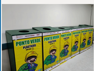
Pasillo Interno Diálisis 1er piso Ed.A