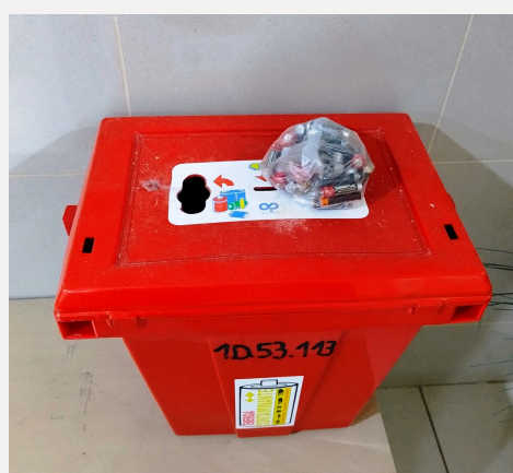
Sala de espera CR Rehabilitación, 1er piso Ed.B

Disposición final de pilas y baterías usadas a través de convenio de colaboración entre el Hospital Clínico y EDELMAG