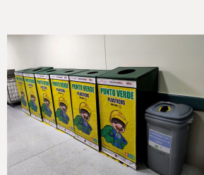
Pasillo Interno CR Diálisis