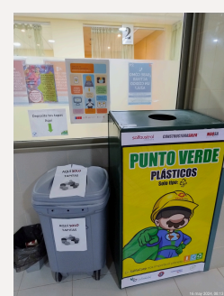
CR. Rehabilitación 1er piso Ed. B

Estas son entregadas al Club de Leones Mujer Austral, quienes las separan, pesan y envían a las Damas de Café en Santiago, quienes recolectan estas a nivel nacional para su venta y uso de utilidades en ayuda a niños y familias que padecen de patologías oncológicas.