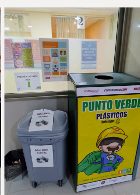
CR. Rehabilitación 1er piso Ed. B