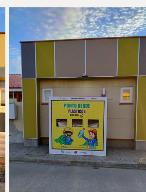
Acceso casa de acogida

A través de convenio de colaboración con "Yo reciclo Magallanes" se reciclan, botellas, bidones y envases plásticos categoría PET1, Mensualmente nuestro hospital entrega aproximadamente 100 kg., de plástico PET 1