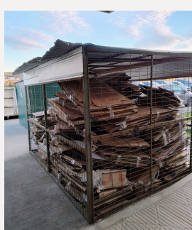
Jaula almacenamiento cartones