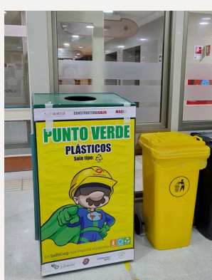
Acceso Zócalo piso -1 Ed. B