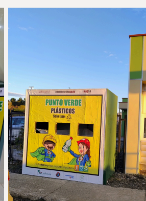
Acceso Jardín Infantil Girasol