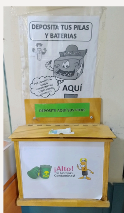
Acceso Edificio D (al lado de cajero automático)